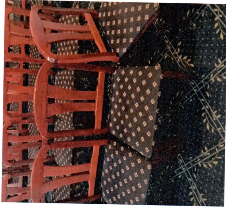
Стул деревянный без ручек с высокой спинкой